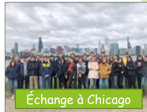
Échange à Chicago