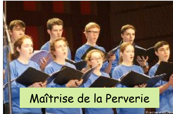
Maîtrise de la Perverie