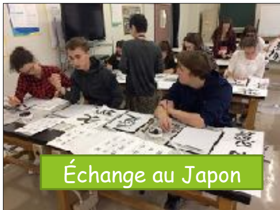
Échange au Japon